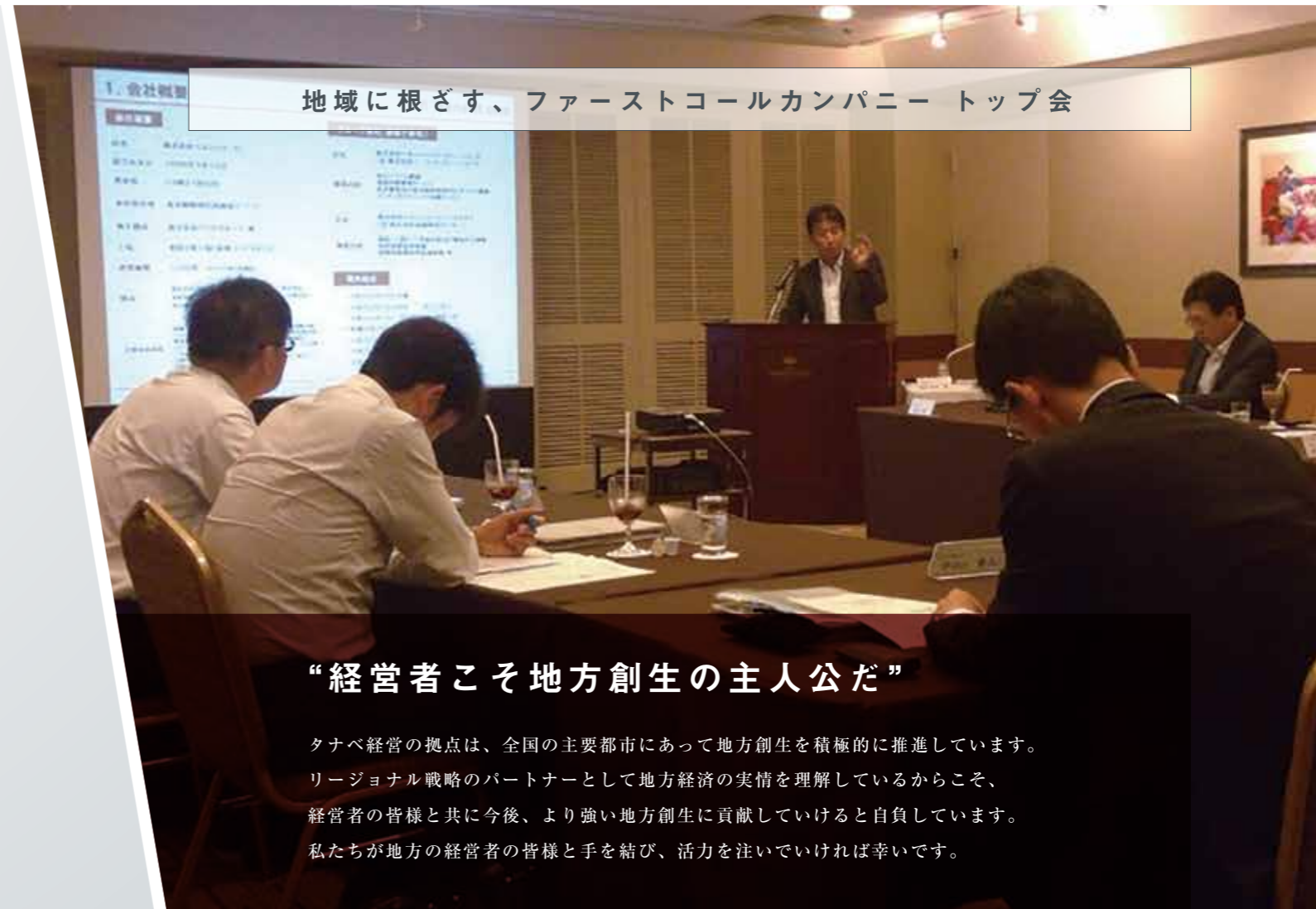
地域に根ざす、ファーストコールカンパニー トップ会