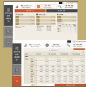
※実際の画面と異なる場合がございます。

経営を「体験」する、 デジタル×リアリティビジネスゲーム 企業経営を体験するシミュレーションゲーム。プレイヤーは経営陣となり、架空の企業を運営します。リアルな意思決定と、デジタルな体験を通じて、経営における総合的な判断力を養い、今後のマネジメントへと活かしていただきます。